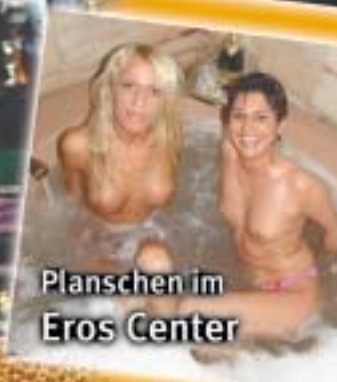
Planschen im Eros Center