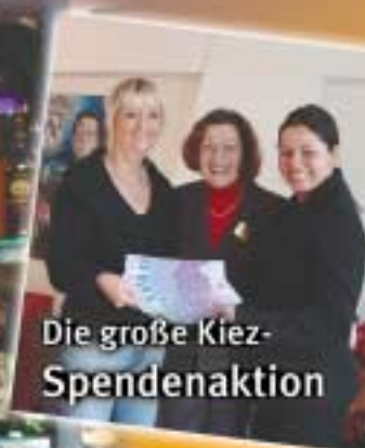
Die große Kiez-Spendenaktion